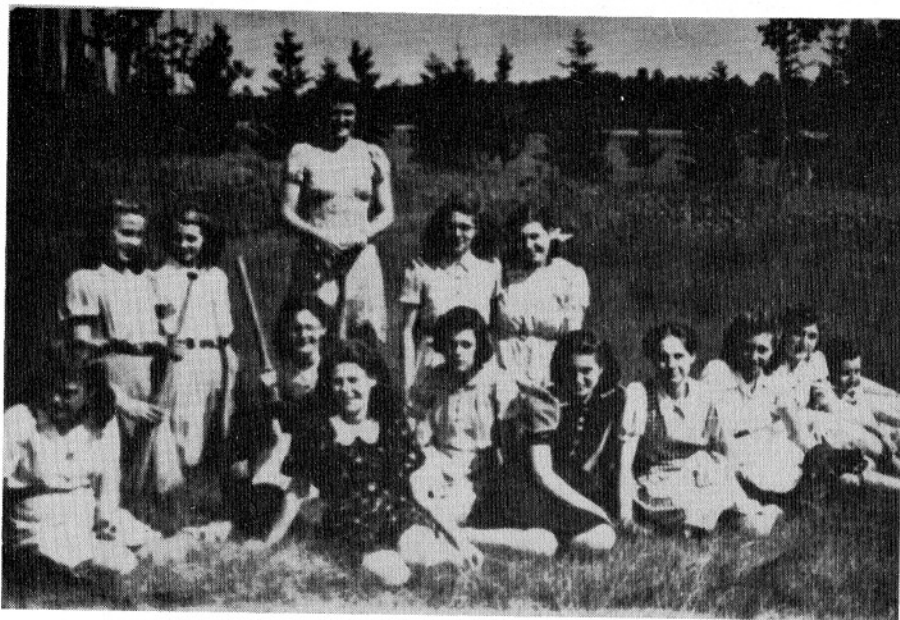
Een groep meisjes na de gymnastiekles op het Hoge land in 1942.

Per 1 sept. 1943 trad de heer A. Vermeer, die sinds 1935 onderwijzer aan de Wis-selse school was, in functie aan de ulo-school.