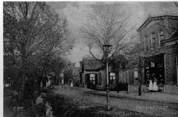
Foto van de Hoofdstraat van Epe in 1910 links de Dorpsbeek

In de jaren vijftig is de Dorpsbeek minder water gaan afvoeren, wat o.a. veroorzaakt wordt doordat er in de bovenloop het water meer naar Wissel geleid wordt en minder op de Dorpsbeek. Hierdoor komt het, dat de beek grote delen van het jaar droog staat.