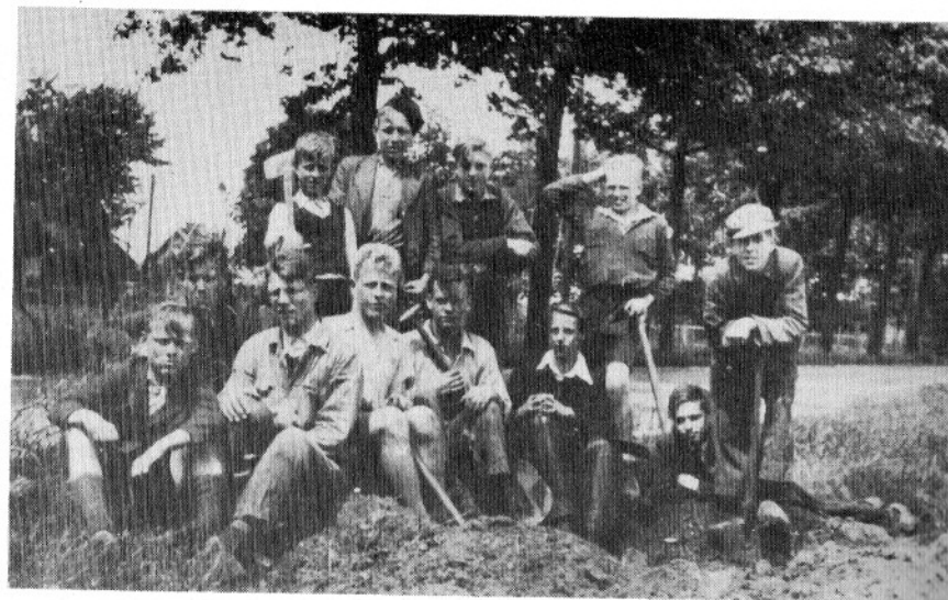
Een groep jongens van de school, opgepakt door de Duitsers in 1944, om graafwerkzaamheden te verrichten voor de O.T. (Organisation Todt).