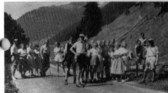
Schoolreis naar Zwitserland in 1949.

Om deze reis voor 46 leerlingen mogelijk te maken (de kosten per persoon bedroegen f 70.-, alles inbegrepen), hadden de leerlingen door het verrichten van allerlei karweitjes het grootste deel van de kosten zelf verdiend. De rest van het benodigde geld werd bijeengebracht door het houden van een bazar. De reis werd een groot succes. Maar de autoriteiten stonden er nog onwennig tegenover. De Inspecteur van het onderwijs keurde deze onderneming in de strengste bewoordingen af en op zijn verzoek, verbood het gemeentebestuur het hoofd der school in het vervolg buitenlandse schoolreizen te organiseren. Opmerkelijk was, dat nog in hetzelfde jaar aan de scholen voor voortgezet onderwijs in den lande een circulaire werd toegestuurd door het departement van onderwijs, waarin het maken van buitenlandse schoolreizen werd aanbevolen, mede om daardoor beter onderling begrip en waardering tussen de jeugd uit verschillende landen te bevorderen.