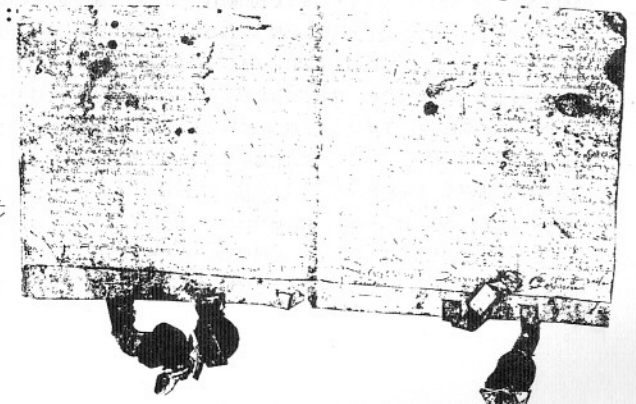
Gildenbrief van het Anthonie Gilde. 9 augustus 1621.

Op 19 augustus 1621 werd de volgende Gildenbrief getekend en van kracht: